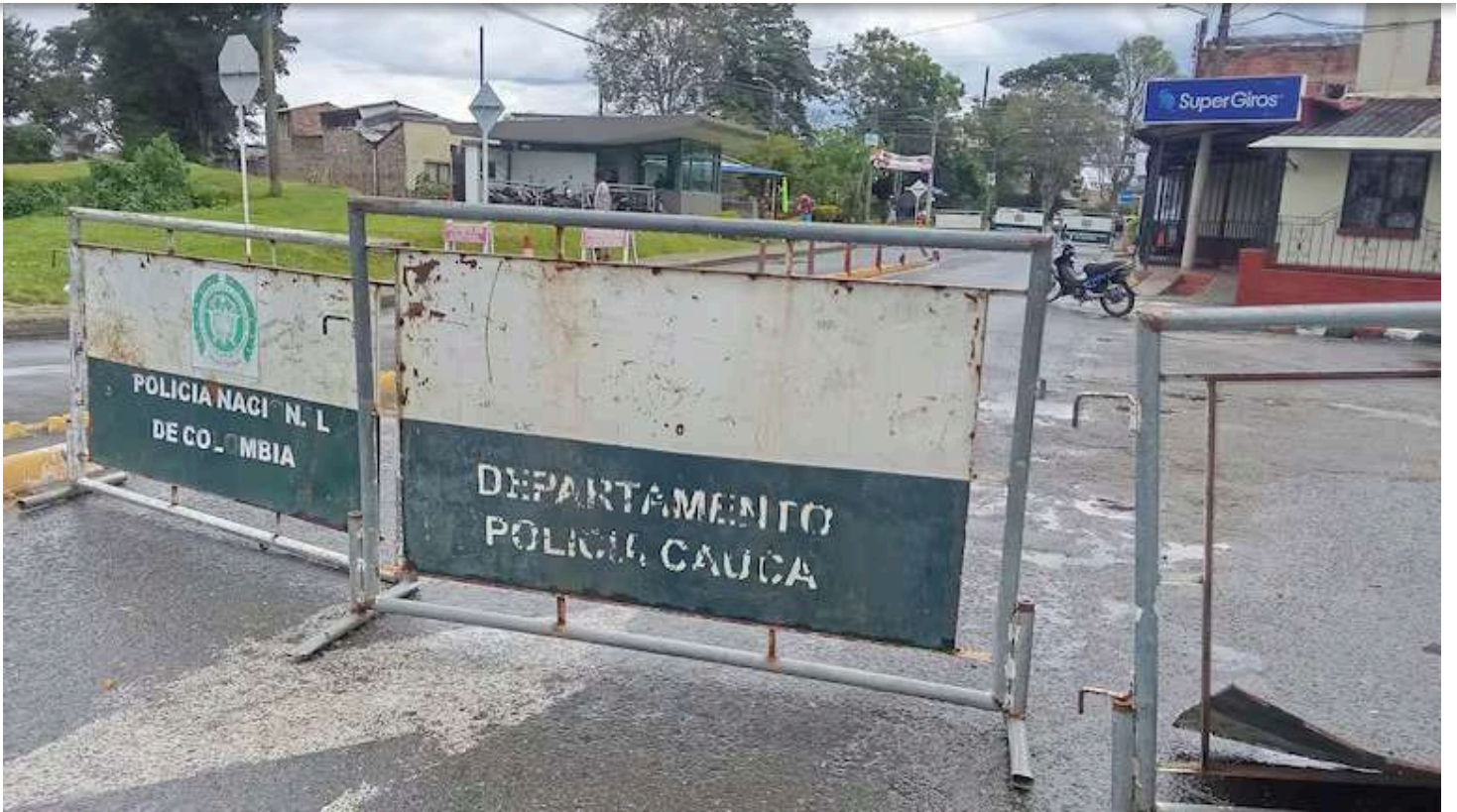
Ya es un constante que tras los recientes golpes militares contra las disidencias de las Farc en el Cauca, las autoridades reforzaron las medidas de seguridad ante posibles retaliaciones de grupos armados ilegales en varios municipios del departamento.